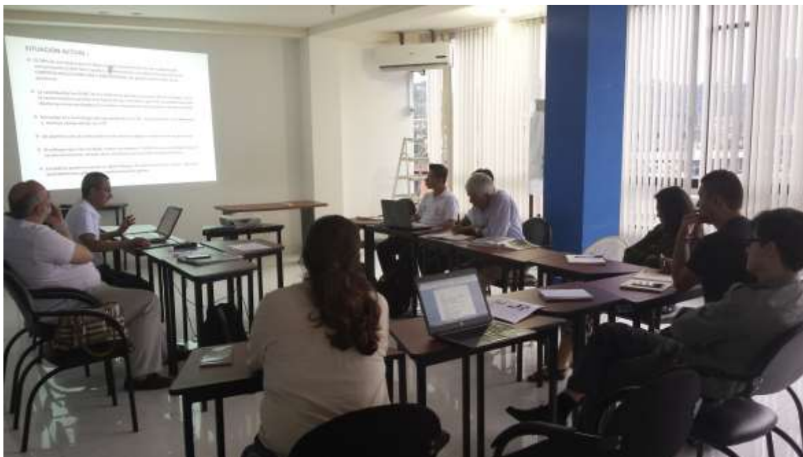
Sala de Reuniones proyecto GEF-NAPO 16.02.2017